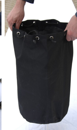
Bild 15, 16, 17: Alle Sprossen zusammenführen und in den geöffneten Sack legen, zuziehen, fertig.