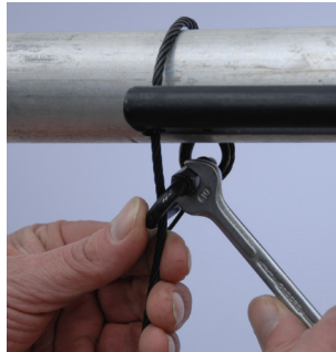
Bild 6: Schnellverbindungsglieder mit einem Maulschlüssel vollständig schließen.