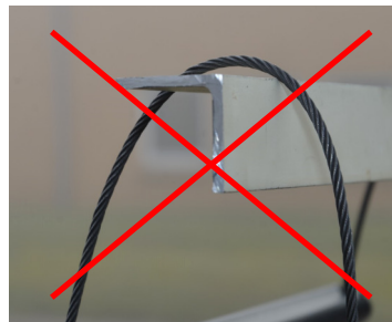
Bild 4: Drahtseil der Seilleiter nicht über scharfe Kanten führen.