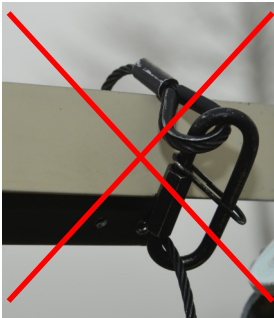
Bild 5: Biege- oder Knickbelastung der Schnellverbindungsglieder und der Verpressungen mit Kauschen vermeiden werden.

Bei der Montage der Seileiter müssen Anschlagvorrichtungen ausreichend tragfähig sein. Ausreichende Tragfähigkeit liegt vor, wenn die Anschlagvorrichtung der Seileiter eine Kraft von F = 2,6\text{kN} aufnehmen kann ohne sich bleibend zu verformen. Eine Biege- oder Knickbelastung der Schnellverbindungsglieder und der Verpressungen mit Kauschen müssen vermieden werden. Die Schnellverbindungsglieder müssen mit einem Gabelschlüssel vollständig geschlossen werden, sodass kein Gewindegang mehr sichtbar ist. Die Anschlagorte müssen so gewählt werden, dass ein sicherer Ein- und Ausstieg aus der Seileiter gewährleistet ist. Die Seileiter muss immer bis zu einer sicheren Standfläche des Kletterers reichen. Bei nicht ausreichender Länge der Seileiter kann am unteren Ende einer Seileiter vom Typ Riggla® eine weitere Seileiter vom Typ Riggla® montiert werden, der Sprossenabstand bleibt bei 315mm. Vor der Montage ist darauf zu achten, dass die Tragseile, die Schnellverbindungsglieder und die Verpressungen mit Kauschen unbeschädigt und frei von Korrosion sind. Die Sprossen müssen unverformt sein und parallel zueinander im Abstand von 315mm stehen. Liegt z.B. eine Verformung eines Schnellverbindungsgliedes oder eine Beschädigung einer Pressklemme, einer Kausche oder einer Sprosse vor, darf das Produkt nicht mehr eingesetzt werden. Korrosionsansatz oder eine fehlende Leichtgängigkeit eines Schnellverbindungsgliedes muss zum sofortigen Austausch der Seileiter führen.